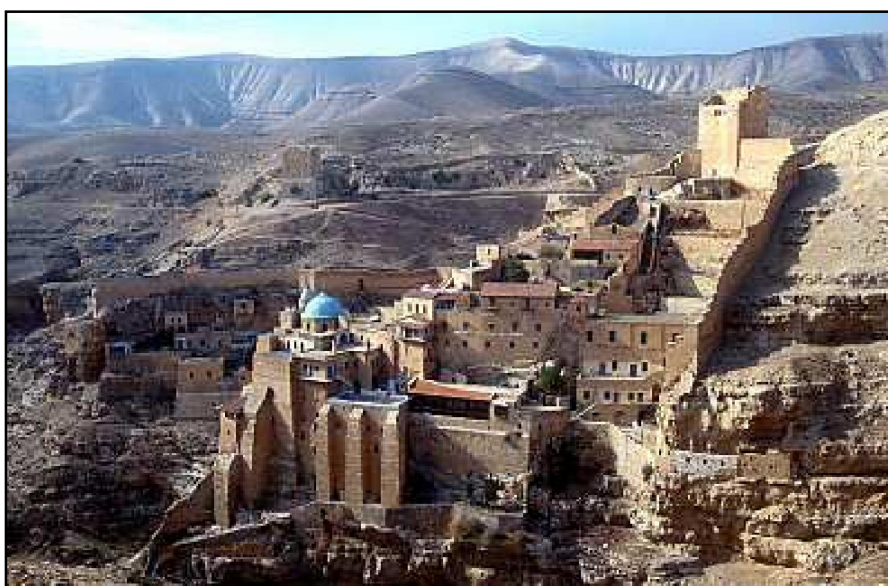
Mănăstirea Sf. Sava (Mar Saba) de lângă Ierusalim

La noi în prezent de asemenea se simte necesitatea de a formula o rânduială tipiconală locală care, pe de o parte să combine tradițiile slavă și româno-bizantină, iar pe de altă parte să dea un caracter oficial unor rânduieli locale sau generale neprevăzute de vechile Tipicuri.